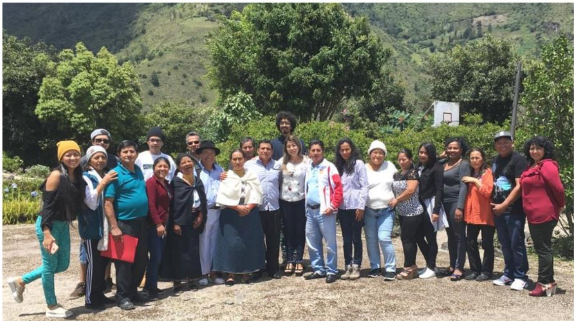
Baños, 14 y 15 de febrero de 2019